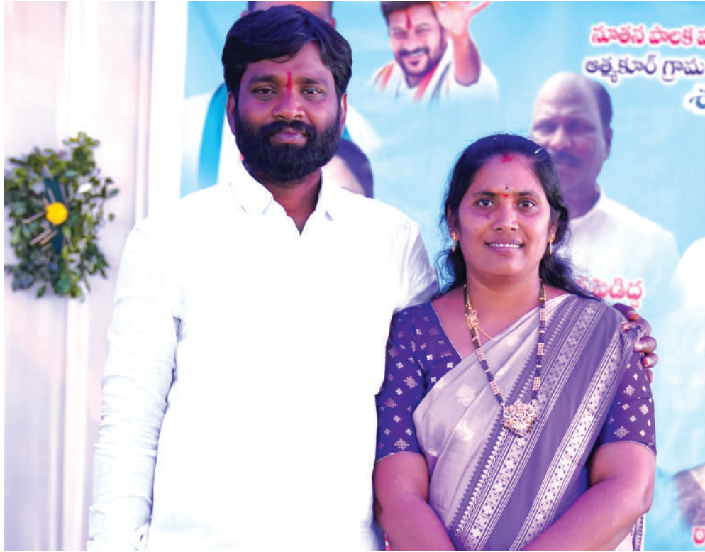
(మన ప్రజాగళం - ఆత్మకూరు): గొప్ప విషయమని, ఆ నమ్మకాన్ని నిరంతర సేవతో రాజకీయాల్లో పదవుల కంటే ప్రజాభిమానాన్ని గెలవడం మరియు వరుస విజయాలతో నిరూపించిన అజేయ