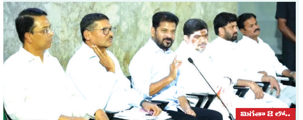
మిగతా 2 లోకం..

మేడే సందర్భంగా ఆర్డీసీ కార్మికుల సంఘాలకు సీఎం రేవంత్ రెడ్డి గుడ్ న్యూస్ చెప్పారు. రాష్ట్రంలో ఆర్డీసీ బలోపేతానికి ప్రభుత్వం కీలక నిర్ణయం తీసుకున్నట్లు తెలిపారు. గాజులూరిపాళం, శంషాబాద్ లో ఐస్ బెర్లియమ్ ఏర్పాటు చేయనున్నట్లు తెలిపారు. అలాగే డిజిల్ ఖర్చులు తగ్గించేందుకు 1000 ఈవీ బస్సుల కొనుగోలు ప్రణాళికలు సిద్ధం చేశామన్నారు. రాష్ట్ర ముఖ్యమంత్రి రేవంత్ రెడ్డి జూబ్లీహిల్స్ నివాసంలో ఆర్డీసీ కార్మికుల సంఘాల నేతలతో కీలక సమావేశం