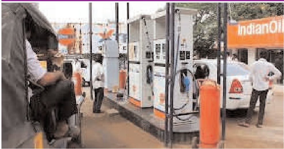
(మొదటి పేజీ తరువాయి..)

పెరగడం వల్ల దేశీయంగా పెట్రోల్, డీజిల్ ధరలు పెంచే అవకాశాన్ని ప్రభుత్వం పూర్తి తోసిపుచ్చలేదు. అంతర్జాతీయ కారణాలు, మధ్యప్రాచ్య ఉద్రిక్తతలు ప్రస్తుత ఇంధన సంక్షోభానికి ప్రధాన కారణం అంతర్జాతీయ భౌగోళిక రాజకీయ పరిస్థితులు. ముఖ్యంగా మధ్య ప్రాచ్యంలో అమెరికా, ఇజ్రాయేల్, ఇరాన్ మధ్య నెలకొన్న సైనిక ఘర్షణలు ప్రపంచ ఇంధన ప్రవాహాన్ని దెబ్బతీశాయి. హైవేలపై క్యూలకు స్పష్ట భారత్లోనే తొలి బారియర్ లెస్ టోల్ ప్లాజా ప్రారంభం ప్రపంచ ముడిచమురు వాణిజ్యంలో ఐదో వంతు వాటా కలిగిన హర్యాణా జలసంధి రవాణా మార్గంలో ఏర్పడిన అంతరాయాలు సరఫరా చైన్ను దెబ్బ తీశాయి. దీని వల్ల గత ఏడాది సగటున 70 డాలర్లుగా ఉన్న ముడిచమురు ధర ఇటీవలి కాలంలో గరిష్టంగా 126 డాలర్లకు చేరింది. ప్రస్తుతం ఇది 110 డాలర్లపైనే కొనసాగుతోంది. ఈ భారీ పెరుగుదల భారత్ చమురు కంపెనీలపై విపరీతమైన