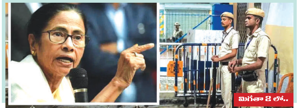
మిగతా 2 లోకం..

పశ్చిమ బెంగాల్ ముఖ్యమంత్రి మమతా బెనర్జీ కోల్ కతాలోని స్ట్రాంగ్ రూమ్ ను సందర్శించి, ఈవీఎల భద్రతపై సంచలన వ్యాఖ్యలు చేశారు. కోల్ కతాలోని స్ట్రాంగ్ రూమ్ లో మూడు గంటలకు పైగా గడిపిన ఆనంతరం తీవ్రంగా హెచ్చరించారు. ఓటింగ్ యంత్రాలను లేదా లెక్ట్రీఫై ప్రక్రియను తారుమారు చేయడానికి చేసే ఏ ప్రయత్నాన్నినా చివరిదాకా ఎదుర్కొంటామని ఆమె అన్నారు. పశ్చిమ బెంగాల్ ముఖ్యమంత్రి మమతా బెనర్జీ కోల్ కతాలోని స్ట్రాంగ్ రూమ్ ను