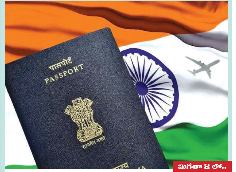
మిగతా 2 లోకం..

భారత ప్రభుత్వం ఓవర్సీస్ సిటిజన్ ఆఫ్ ఇండియా (OCI) కార్డుదారులు, పౌరసత్వ ప్రక్రియలో కీలక మార్పులు చేస్తూ పౌరసత్వ (సవరణ) నిబంధనలు, 2026ను అమల్లోకి తెచ్చింది. కేంద్ర హోం మంత్రిత్వ శాఖ గురువారం (ఏప్రిల్ 30) విడుదల చేసిన గెజిట్ నోటిఫికేషన్ ప్రకారం, ఈ సవరణలు ప్రధానంగా డిజిటలైజేషన్, పారదర్శకతపై దృష్టి సారించాయి. భారత ప్రభుత్వం ఓవర్సీస్ సిటిజన్ ఆఫ్ ఇండియా (OCI) కార్డుదారులు, పౌరసత్వ ప్రక్రియలో కీలక మార్పులు చేస్తూ పౌరసత్వ (సవరణ) నిబంధనలు, 2026ను అమల్లోకి తెచ్చింది. కేంద్ర