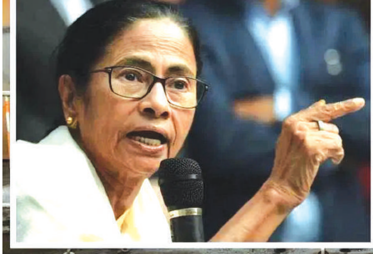
(మొదటి పేజీ తరువాయి..)

సందర్భించి, ఈవీఎల భద్రతపై సంవలన వ్యాఖ్యలు చేశారు. కోల్కతాలోని స్ట్రాంగ్ రూమ్లో మూడు గంటలకు పైగా గడిపిన అనంతరం తీరాంగా హెచ్చరించారు. ఓటింగ్ యంత్రాలను లేదా లెక్చింగు ప్రక్రియను తారుమారు చేయడానికి చేసే ఏ ప్రయత్నాన్నినా చివరిదాకా ఎదుర్కొంటామని ఆమె అన్నారు. మే 4వ తేదీన జరగనున్న ఓట్ల లెక్చింగును ముందు, ఎన్నికల ప్రక్రియలో అవకతవకలు జరుగుతున్నాయని ఆరోపిస్తూ ఆమె రాజకీయ దుమారం రేపారు.