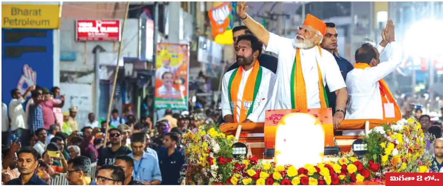
మిగతా 2 లోకం..

మన ప్రజాగళం, న్యూఢిల్లీ పాగా వేయడమే లక్ష్యంగా భారతీయ జనతా పార్టీ తన సరేంద్ర మోదీ పర్యటన ఖారూ అయింది. ఐదు రాష్ట్రాల ఎన్నికల ఫలితాల ఆనంతరం రాష్ట్రంలో వ్యూహాలకు పదును పెడుతోంది. ఈ క్రమంలోనే ప్రధాని తెలంగాణ రాజకీయాల్లో ప్రధాన ప్రత్యామ్నాయ శక్తిగా