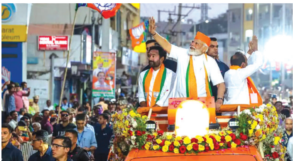
(మొదటి పేజీ తరువాయి..)

ఎరగాలని బీజేపీ కృతనిశ్చయంతో ఉంది. ఐదు రాష్ట్రాల ఎన్నికల్లో బీజేపీ సానుకూల ఫలితాలను ఆశిస్తోంది. ఈ ఫలితాలు వెలువడిన వారం రోజుల్లోనే ప్రధాని నరేంద్ర మోదీని రంగంలోకి దించి, తెలంగాణలో రాజకీయ ప్రకంపనలు సృష్టించాలని అధిష్టానం ప్రణాళిక సిద్ధం చేసింది. ఈ పర్యటనలో అభివృద్ధి కార్యక్రమాలతో పాటు జనాగ్రహ సభను కూడా ఖరారు చేసింది. రాష్ట్ర ప్రభుత్వంపై ఉన్న ప్రజల అసంతృప్తిని తమకు అనుకూలంగా మార్చుకోవాలని పార్టీ భావిస్తోంది. బెంగాల్లో గెలిస్తే ఆగరు! ముఖ్యంగా పశ్చిమ బెంగాల్ ఫలితాలపై బీజేపీ భారీ