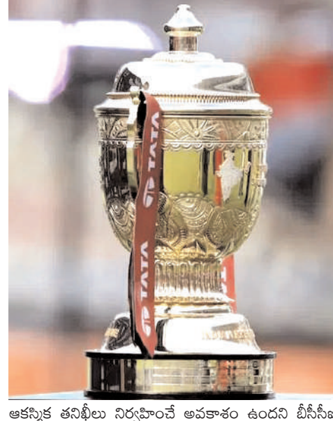
ఆకస్మిక తనిఖీలు నిర్వహించే అవకాశం ఉందని బీసీసీఐ