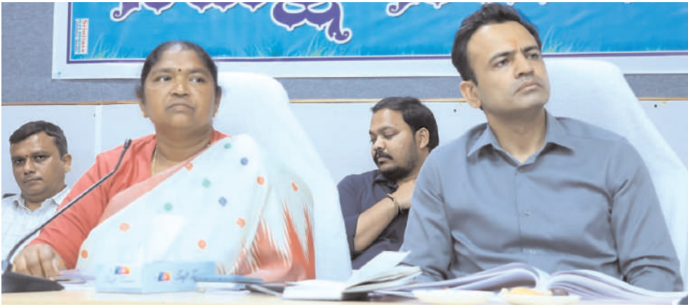
ములుగు, మే 8 (మన ప్రజాగళం) ములుగు జిల్లా అభివృద్ధి పనుల పురోగతిపై రాష్ట్ర శాఖ మంత్రి ధనసరి అనసూయ సీతక్క సమీక్ష

అధికారులతో మంత్రి సీతక్క సమావేశం పనుల పురోగతిపై శాఖల వారీగా చర్చ సమన్వయంతో పనులు పూర్తి చేయాలని సూచన