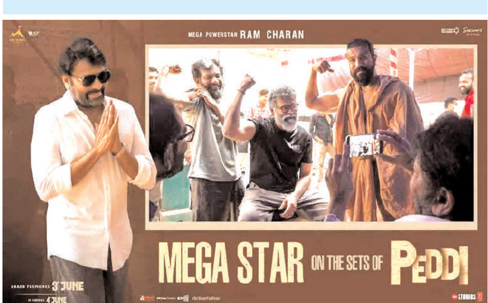
మోగ పవర్ స్టార్ రామ్ చరణ్ హీరోగా, దర్శకుడు బుచ్చిబాబు సానా తెరకెక్కిస్తున్న ప్రతిష్టాత్మక స్పోర్ట్స్ యాక్షన్ చిత్రం 'పెద్ది' షూటింగ్ ప్రస్తుతం చివరి దశకు చేరుకుంది. ఇప్పటికే ఈ సినిమాపై భారీ అంచనాలు నెలకొన్న వేళ.. తాజాగా మోగస్టార్ చిరంజీవి స్వయంగా సినిమా సెట్ కు వెళ్లి చిత్రబృందాన్ని ఉత్సాహపరిచారు. దీనికి సంబంధించిన వీడియో ప్రస్తుతం సామాజిక మాధ్యమాల్లో వైరల్ గా మారింది. ఉత్తరాంధ్ర గ్రామీణ నేపథ్యంలో కుస్తీ క్రింద ఆధారంగా రూపొందుతున్న ఈ సినిమాలో రామ్ చరణ్ పూర్తిగా భిన్నమైన పాత్రలో కనిపించనున్నారు. ఇటీవల విడుదలైన 'పెద్ది పెట్రోస్' గ్లింప్స్ కు ప్రేక్షకుల నుంచి అద్భుత స్పందన వచ్చిన సంగతి తెలిసిందే. ఈ క్రమంలో షూటింగ్ జరుగుతున్న ప్రదేశానికి చిరంజీవి వెళ్లి అక్కడి వాతావరణాన్ని దగ్గరుండి పరిశీలించారు. రామ్ చరణ్ లుక్, సెట్స్ నిర్మాణం, యాక్షన్ సన్నివేశాలు చిత్రీకరణ విధానం చూసి చిరంజీవి ఎంతో ఆనందం వ్యక్తం చేసినట్లు సమాచారం. షూటింగ్ విరామ సమయంలో చిత్రబృందంతో చిరంజీవి సరదాగా ముచ్చటించారు. దర్శకుడు బుచ్చిబాబు సానా పనితీరును ప్రశంసించి సినిమా విజయం భాయమని నమస్కరిస్తూ వ్యక్తం చేసినట్లు తెలుస్తోంది. సెట్స్ లో చిరంజీవి సందడి చేయడంతో యూనిట్ సభ్యుల్లో కొత్త ఉత్సాహం కనిపించింది. ఈ సందర్భంగా దర్శకుడు బుచ్చిబాబు తన సామాజిక మాధ్యమం ఖాతాలో వీడియోను పంచుకుంటూ.. "మోగస్టార్ మా సెట్ కు రావడం మా అదృష్టం. ఆయన మాటలు మాకు మరింత ప్రేరణ ఇచ్చాయి" అంటూ భావోద్వేగ వ్యాఖ్యలు చేశారు. ఈ చిత్రంలో బాలీవుడ్ నటి జాన్వీ కపూర్ కథానాయికగా నటిస్తుండగా.. కన్నడ స్టార్ శివరాజ్ కుమార్, జగపతిబాబు కీలక పాత్రల్లో కనిపించనున్నారు. ఆస్కార్ విజేత ఏజర్ రెహమాన్ సంగీతం అందిస్తున్న ఈ చిత్రాన్ని భారీ నిర్మాణ విలువలతో తెరకెక్కిస్తున్నారు. గ్రామీణ భావోద్వేగాలు, కుస్తీ పోటీలు, మాస్ యాక్షన్ అంశాలతో రూపొందుతున్న ఈ సినిమా వచ్చే నెలలో ప్రపంచవ్యాప్తంగా విడుదలయ్యే అవకాశాలు ఉన్నాయని సినీ పర్సాలు చెబుతున్నాయి.