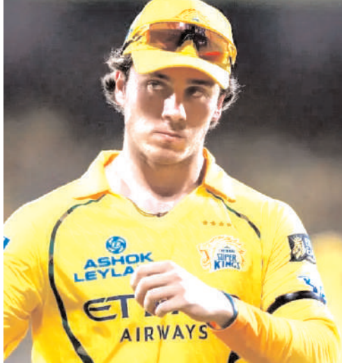
చెన్నై, మే 8 మన ప్రజాగళం న్యూస్ : ఐపీఎల్లో చెన్నై సూపర్ కింగ్స్ జట్టుకు ఉన్న అభిమానమే ప్రత్యేకం. తాజాగా ఆ జట్టుకు చెందిన యువ వికేట్ ఆటగాళ్లు డెవ్లెట్ బ్రెవిస్, సూర అహ్మద్ చెన్నై నగర వీధుల్లో చేసిన సందడి అభిమానులను ఆకట్టుకుంటోంది. స్టార్ క్రికెటర్ల హంగులు పక్కనపెట్టి సామాన్యుల నగరాన్ని చుట్టేస్తూ అభిమానులతో కలిసిపోయారు. మ్యూజిల్ మధ్యలో దొరికిన విరామ సమయంలో ఈ ఇద్దరు ఆటగాళ్లు ఖరీదైన కార్లను వదిలేసి ఆటో రిక్షాలో ప్రయాణించారు. చెన్నై వీధుల్లో ఆటోలో కనిపించిన వారిని చూసి అభిమానులు ఆశ్చర్యపోయారు. స్థానిక సంస్థానిని ఆహ్వానిస్తూ వారు చేసిన ఈ ప్రయాణం ప్రస్తుతం సామాజిక మాధ్యమాల్లో వైరల్ గా మారింది. అక్కడితో ఆగకుండా ఓ స్థానిక మైదానానికి వెళ్లిన బ్రెవిస్, సూర అహ్మద్ అక్కడ క్రికెట్ ఆడుతున్న చిన్నారులతో కలిసి గట్టి క్రికెట్ ఆడారు. చిన్నారులు బొరింగ్ చేయగా బ్రెవిస్ సరదాగా షాట్లు ఆడుతూ అలరించారు. అభిమానులతో చేతులు కలుపుతూ, ఫోటోలు దిగుతూ ఇద్దరూ సందడి చేశారు. తమ అభిమాన ఆటగాళ్లు ఇలా సాధారణ ప్రజల మధ్య కలిసిపోవడంతో సీఎస్కే అభిమానులు ఆనందం వ్యక్తం చేస్తున్నారు. ప్రస్తుతం ఈ వీడియోలు, ఫోటోలు నెట్టింట్ విపరీతంగా వైరల్ అవుతున్నాయి.

- ఆటోలో షికారు.. పిల్లలతో గట్టి క్రికెట్