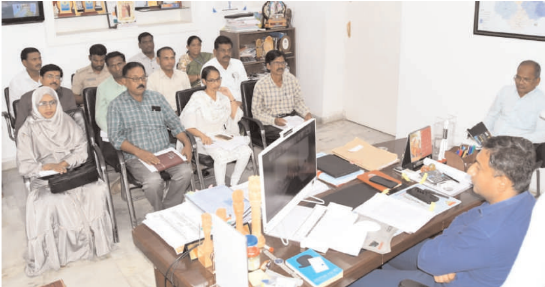
మార్కెటింగ్ శాఖల అధికారులు పాల్గొన్నారు.