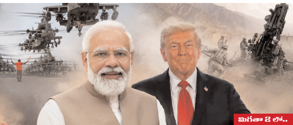
మిగతా 2 లో..

వాషింగ్టన్, 19 మే (మన ప్రజాగళం): భారత్ కీలక రక్షణ ఒప్పందాలకు అమెరికా విదేశాంగ శాఖ ఆమోదం తెలిపినట్లు సమాచారం. సుమారు నాలుగు వేల కోట్ల రూపాయల విలువైన రెండు ప్రధాన సైనిక ఒప్పందాలకు అనుమతి లభించినట్లు తెలుస్తోంది. ఈ ఒప్పందం ద్వారా అపాచీ అలాగే అట్లా లైట్ హోవిజ్జర్ వ్యవస్థలకు సహకారం, సేవల కోసం ఇరవై అట్లా లైట్ హోవిజ్జర్ వ్యవస్థలకు మద్దతు పొందనుంది. ఈ ఒప్పందంలో భాగంగా అపాచీ హెలికాప్టర్ల సపోర్ట్ సేవల కోసం దాదాపు పందొమ్మిది కోట్ల ఎనభై లక్షల డాలర్లు ఖర్చు చేయనున్నారు. అలాగే అట్లా లైట్ హోవిజ్జర్ వ్యవస్థల నిర్వహణ, సేవల కోసం ఇరవై మూడు కోట్ల డాలర్లు కేటాయించనున్నారు. ఈ ఒప్పందాల ద్వారా భారత సైనిక సామర్థ్యాలు మరింత బలోపేతం అవుతాయని అమెరికా విదేశాంగ శాఖ