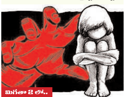
మిగతా 2 లో..

దెస్సె, 19 మే (మన ప్రజాగళం): దేశంలో మహిళలపై జరుగుతున్న లైంగిక దాడుల ఘటనలు మరోసారి ఆందోళన కలిగిస్తున్నాయి. చిన్నారల