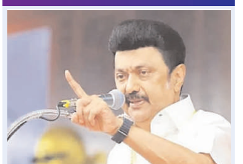
తమిళనాడు, 19 మే (మన ప్రజాగళం):

ఎప్పుడైనా ప్రభుత్వం కులిపోవచ్చని వ్యాఖ్య ముందస్తు ఎన్నికలకు సిద్ధంగా ఉండాలని డీఎంకే త్రేణులకు పిలుపు సామాజిక మాధ్యమాల్లో చురుకుగా ఉండాలని సూచన