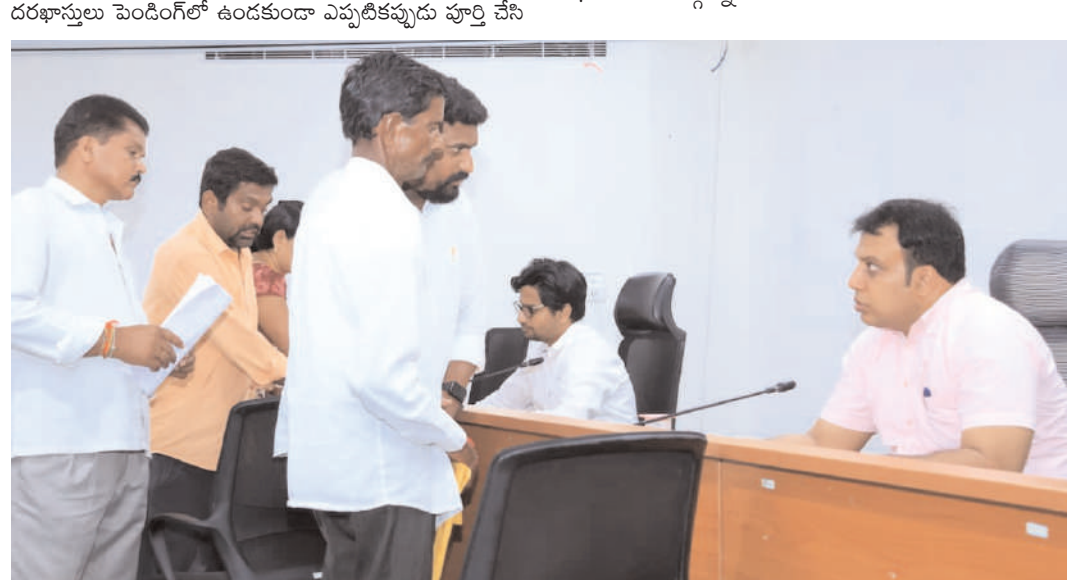
దరఖాస్తులు పెండింగ్లో ఉండకుండా ఎప్పటికప్పుడు పూర్తి చేసి

జనగామ, మే 19 మన ప్రజాగళం స్టూన్ : ప్రజావాణిలో వివిధ సమస్యలతో వచ్చే ప్రజల అర్బిలపై ప్రత్యేక దృష్టి సారించి త్వరితగతిన పరిష్కారానికి చర్యలు తీసుకోవాలని జిల్లా కలెక్టర్ సందీప్ కుమార్ రూపా అధికారులను ఆదేశించారు. ప్రజల సమస్యల పరిష్కారంలో ఎలాంటి జాప్యం చోటుచేసుకోకుండా బాధ్యతాయుతంగా వ్యవహరించాలని సూచించారు. సోమవారం జిల్లా సమీకృత కలెక్టర్ కార్యాలయంలోని ప్రధాన సమావేశ మందిరంలో నిర్వహించిన ప్రజావాణి కార్యక్రమంలో అదనపు కలెక్టర్ (రెవెన్యూ) డెన్నాలోమితో కలిసి జిల్లా కలెక్టర్ ప్రజల నుంచి ఫిర్యాదులు, వినతిపత్రాలను స్వీకరించి పరిశీలించారు ఈ సందర్భంగా ప్రజల సమస్యలపై అర్బిలను కలెక్టర్ నేరుగా పరిశీలించి సంబంధిత శాఖల అధికారులకు కేటాయించారు. ప్రజా సమస్యలను సకాలంలో గుర్తించి తగిన చర్యలు తీసుకోవాలని, సమస్యల పరిష్కారానికి వేగంగా స్పందించాలని అధికారులను ఆదేశించారు. ప్రజావాణిలో అందిన ప్రతి దరఖాస్తును బాధ్యతగా పరిశీలించి త్వరితగతిన పరిష్కరించేందుకు చర్యలు చేపట్టాలని సూచించారు.