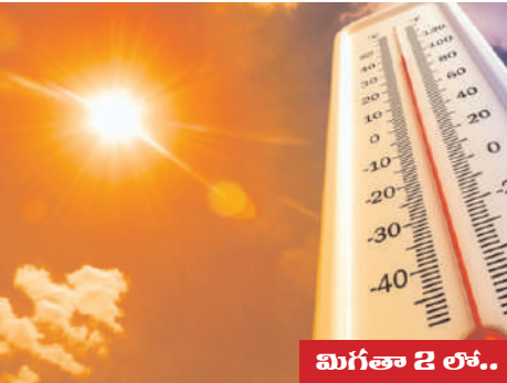
మిగతా 2 లో..

హైదరాబాద్, మే 20 (మన ప్రజాగళం): తెలుగు రాష్ట్రాల్లో భానుడు తన ప్రతాపాన్ని కొనసాగిస్తున్నాడు. ఆంధ్రప్రదేశ్, తెలంగాణ రాష్ట్రాల్లో పలు జిల్లాల్లో అత్యధిక ఉష్ణోగ్రతలు నమోదవుతుండటంతో ప్రజలు ఉక్కుపోతతో ఇబ్బందులు పడుతున్నారు. .