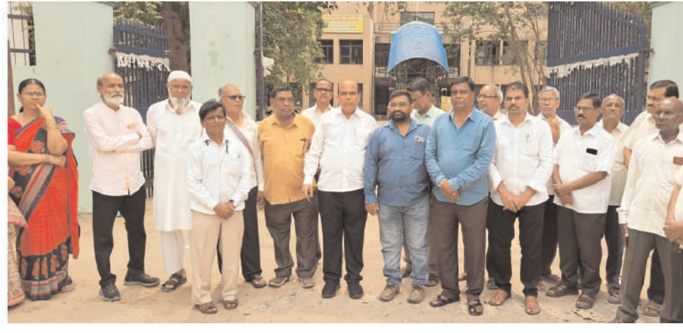
సంగారెడ్డి ప్రతినిధి,మన ప్రజాగళం .. భారత్ సంచార్ నిగం లిమిటెడ్ ( బిఎస్ఎన్ఎల్) లోని అన్ని యూనియన్స్, అసోసియేషన్ ఐక్య వేదిక పిలుపుమేరకు దేశ వ్యాప్తం సమ్మెలో పాల్గొన్న ఉమ్మడి మెడక్ జిల్లా బిఎస్ఎన్ఎల్ ఉద్యోగులు..గత జనవరి నెల నుండి పెండింగ్ ఉన్న ఐ డి ఏ బకాయిలను తక్షణమే చెల్లించాలని, 2017 నుండి రావలసిన పే రివిజన్ ను అమలు చేస్తూ పెండింగ్ లో ఉన్న అన్ని సమస్యలను పరిష్కరించాలని కోరుతూ సంగారెడ్డి కేంద్ర కార్యాలయం ఎదుట ఉద్యోగులు డే లాంగ్ ధర్నాను నిర్వహించారు..