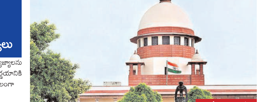
మిగతా 2 లో..

న్యూఢిల్లీ, మే 20 (మన ప్రజాగళం): దాఖలైన ప్రజాప్రయోజన వ్యాజ్యాలను దేశంలో కులగణన ప్రక్రియకు కొట్టివేస్తూ కేంద్ర ప్రభుత్వ నిర్ణయానికి సంబంధించి సుప్రీంకోర్టు కీలక తీర్పు వెలువరించింది. కులగణనను వ్యతిరేకిస్తూ అత్యున్నత న్యాయస్థానం అనుకూలంగా మిగతా 2 లో..