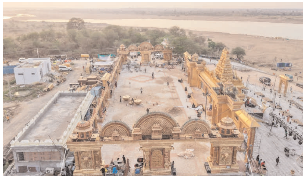
(మొదటి పేజీ తరువాయి..)

సేవలు, పారిశుధ్య సదుపాయాలు, విశ్రాంతి కేంద్రాలు అందుబాటులో ఉండేలా చూడాలని అధికారులను ఆదేశించారు. భక్తుల రాకపోకలకు అటంకం కలగకుండా ట్రాఫిక్ నియంత్రణపై ప్రత్యేక దృష్టి పెట్టాలని సూచించారు. వాహనాల పార్కింగ్, మార్గదర్శక బోర్డులు, ప్రత్యేక రవాణా ఏర్పాట్లపై సంబంధిత శాఖలు సమగ్ర ప్రణాళికతో ముందుకెళ్లాలని పేర్కొన్నారు. వేసవి తీవ్రత దృష్ట్యా భక్తులు ఆరోగ్యంపై ప్రత్యేక శ్రద్ధ వహించాలని ముఖ్యమంత్రి సూచించారు. ఎండలు అధికంగా ఉన్న సేపట్లో నీరు ఎక్కువగా తీసుకోవడం, అవసరమైన జాగ్రత్తలు పాటించడం ద్వారా ఆరోగ్య సమస్యలను నివారించాలని కోరారు. ఆధ్యాత్మిక వాతావరణంలో ప్రకాశంగా, భక్తిపూర్వకంగా సరస్వతీ అంత్వ పుష్కరాలు జరగాలని సీఎం అంకంబించారు. రాష్ట్ర ప్రజలందరికీ పుష్కర శుభాకాంక్షలు తెలియజేస్తూ, ఈ మహోత్సవాన్ని విజయవంతం చేయాలని పిలుపునిచ్చారు