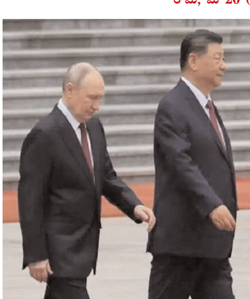
రోమ్, మే 20 (మన ప్రజాగళం):

అభిప్రాయాలు పంచుకున్నట్లు తెలుస్తోంది. రెండు రోజుల పాటు పుతిన్ చైనాలో పర్యటించనున్నారు. ఈ పర్యటన సమయంలో పలు కీలక ఒప్పందాలు, పూర్వోత్పక చర్చలు జరిగే అవకాశం ఉందని అంతర్జాతీయ వర్గాలు భావిస్తున్నాయి. రష్యా--చైనా సంబంధాల భవిష్యత్తుపై కూడా ఈ సమావేశం ప్రభావం చూపే అవకాశం ఉంది. ఇటీవలి అమెరికా అధ్యక్షుడు డొనాల్డ్ ట్రంప్ చైనా పర్యటనకు వెళ్లిన విషయం తెలిసిందే. ప్రపంచ అగ్రదేశాలైన అమెరికా, రష్యా అధ్యక్షులు తక్కువ వ్యవధిలోనే చైనాను సంధించడం ప్రపంచ రాజకీయాల్లో ఆసక్తికర పరిణామంగా మారింది. చైనా పర్యటన సందర్భంగా పుతిన్ మాట్లాడుతూ రష్యా--చైనా సంబంధాలు ప్రస్తుతం ఉన్నత దశకు చేరుకున్నాయని వ్యాఖ్యానించారు. ఇరు దేశాల మధ్య పూర్వోత్పక భాగస్వామ్యం మరింత బలోపేతం అవుతుందని ఆయన పేర్కొన్నట్లు సమాచారం.