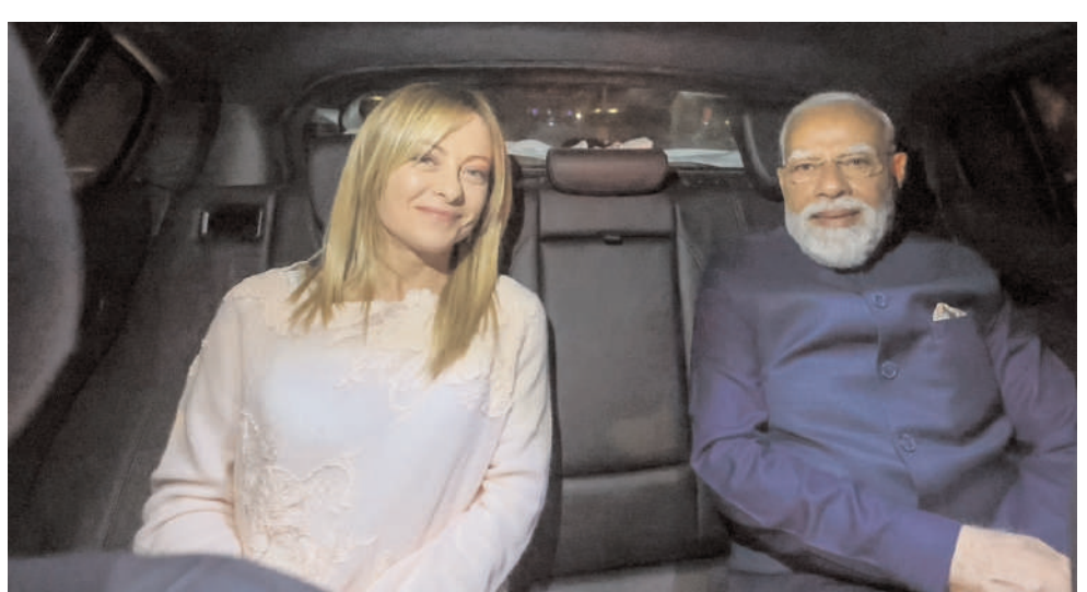
రోమ్, మే 20 (మన ప్రజాగళం):

భారత ప్రధానమంత్రి నరేంద్ర మోదీ ఇటలీ పర్యటనలో భాగంగా ఇటలీ అధ్యక్షుడు సెర్జియో మట్టరెల్లాను రోమ్లో కలిశారు. ఈ సందర్భంగా భారత్--ఇటలీ మధ్య ద్వైపాక్షిక సంబంధాలకు సంబంధించిన పలు కీలక అంశాలపై ఇరువురు నేతలు విస్తృతంగా చర్చించారు. ఇరు దేశాల మధ్య స్నేహ సంబంధాలను మరింత బలోపేతం చేసే దిశగా సమావేశం జరిగినట్లు సమాచారం. ముఖ్యంగా వాణిజ్యం, పెట్టుబడులు, సాంస్కృతిక సంబంధాలపై ప్రత్యేకంగా చర్చించినట్లు ప్రధాని మోదీ వెల్లడించారు. రెండు దేశాల మధ్య సహకారాన్ని మరింత విస్తరించేందుకు పలు అంశాలను పరిశీలించినట్లు తెలిపారు. అత్యాధునిక సాంకేతిక రంగాల్లో కూడా సహకారంపై చర్చలు జరిగాయి. కృత్రిమ మేధస్సు, కీలక ఖనిజాలు, అంతరిక్ష రంగం, అణుశక్తి వంటి పూర్వోత్పక రంగాల్లో కలిసి పనిచేసే అవకాశాలపై అభిప్రాయాలు పంచుకున్నట్లు వెల్లడించారు. ప్రపంచవ్యాప్తంగా సాంకేతిక రంగంలో వేగంగా మార్పులు చోటుచేసుకుంటున్న సేవలపై వరసగా భాగస్వామ్యం మరింత అవసరమని నేతలు భావించినట్లు తెలుస్తోంది. భవిష్యత్తు అవసరాలకు అనుగుణంగా కొత్త భాగస్వామ్యాలకు మార్గం సుగమం చేసే అంశాలపై చర్చలు సాగినట్లు సమాచారం. ఇటీవలి కాలంలో భారత్--ఇటలీ మధ్య సంబంధాలు మరింత బలపడుతున్నాయి. వ్యాపారం, రక్షణ, సాంకేతిక రంగాల్లో ఇరు దేశాలు పరస్పర సహకారాన్ని పెంచుకుంటున్నాయి. ఈ సమావేశం కూడా ఆ దిశగా మరో కీలక అడుగుగా భావిస్తున్నారు. ఇరు దేశాల మధ్య స్నేహబంధాన్ని మరింత ఉన్నత స్థాయికి తీసుకెళ్లేందుకు ఈ భేటీ ఉపయోగపడుతుందని రాజకీయ పరిశీలకులు అభిప్రాయపడుతున్నారు. రాజీయే రోజుల్లో పలు రంగాల్లో సహకారం మరింత విస్తరించే అవకాశాలు కనిపిస్తున్నాయని చెబుతున్నారు.