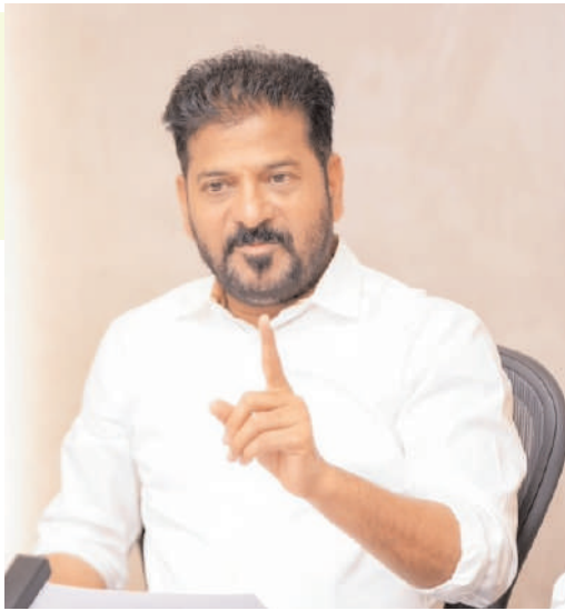
సౌకర్యాలు కల్పించాలని ఆదేశించారు. మధ్యాహ్నం సమయంలో అత్యవసరం అయితే తప్ప ప్రయాణాలు చేయకుండా ఉండాలని ప్రజలకు మిగతా 2 లో..

విద్యుత్ సరఫరాపై ప్రత్యేక దృష్టి పెట్టాలని ఆదేశించారు. ఆరోగ్య శాఖ అధికారులు కూడా పూర్తిస్థాయిలో అప్రమత్తంగా ఉండాలని సీఎం సూచించారు. ప్రాథమిక ఆరోగ్య కేంద్రాల నుంచి జిల్లా ఆసుపత్రుల వరకు వైద్య సిబ్బంది అందుబాటులో ఉండాలని పేర్కొన్నారు. వడదెబ్బ కారణంగా ఎవరైనా ఆసుపత్రుల్లో చేరితే వారికి వెంటనే వైద్య సేవలు అందించాలని స్పష్టం చేశారు. రాష్ట్రంలోని వట్టణ ప్రాంతాల్లో అవసరమైన మేరకు చలివేంద్రాలు ఏర్పాటు చేయాలని సీఎం సూచించారు. వేసవి తీవ్రత దృష్ట్యా ప్రజలకు ఉపశమనం కలిగించే చర్యలను వేగంగా అమలు చేయాలని అధికారులకు తెలిపారు. ముఖ్యంగా జనసంచారం ఎక్కువగా ఉండే ప్రాంతాల్లో తాగునీటి