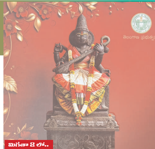
మిగతా 2 లో..

కాళేశ్వరం, మే 20 (మన ప్రజాగళం): పుష్కరాల నిర్వహణలో సరస్వతీ అంత్య పుష్కరాలను భక్తిశ్రద్ధలతో ఎలాంటి లోపాలు లేకుండా వైభవంగా నిర్వహించాలని తెలంగాణ ముందస్తు ప్రణాళికతో ముఖ్యమంత్రి ఎ. రేవంత్ రెడ్డి పిలుపునిచ్చారు. మే 21 నుంచి జూన్ 1 వరకు కాళేశ్వరంలో తీసుకోవాలని సూచించారు. వృషభ జరగనున్న పుష్కరాల కోసం రాష్ట్ర ప్రభుత్వం విస్తృత స్థాయిలో ఏర్పాట్లు చేపట్టిస్తోంది తెలిపారు. దేశంలోని వివిధ ప్రాంతాల నుంచి పెద్ద ఎత్తున భక్తులు తరలివచ్చే అవకాశాలు ఉన్న నేపథ్యంలో అన్ని శాఖలు సమన్వయంతో పనిచేయాలని పేర్కొన్నారు. స్నాన ఘాట్ల వద్ద భద్రత, తాగునీరు, వైద్య ముఖ్యమంత్రి అధికారులకు ఆదేశించారు.