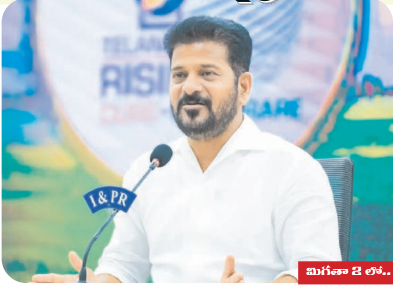
మిగతా 2 లో..

హైదరాబాద్, మే 21 (మన ప్రజాగళం): జనగణనలో కులగణన అంశాన్ని చేర్చడంలో తెలంగాణ రాష్ట్రం దేశానికి దశ, దశ చూపించిన రాష్ట్రంగా నిలిచిందని ముఖ్యమంత్రి రేవంత్ రెడ్డి అన్నారు. జనాభా లెక్కల్లో కులగణన అంశాన్ని సుప్రీంకోర్టు సమర్థించడం స్వాగతించదగ్గ పరిణామమని పేర్కొన్నారు. ఈ అంశంపై రాష్ట్ర ప్రభుత్వ నిర్ణయానికి మరింత బలం చేకూరిందని అభిప్రాయపడ్డారు. సుప్రీంకోర్టు నిర్ణయం వెలువడిన నేపథ్యంలో కేంద్ర ప్రభుత్వం తక్షణమే దేశవ్యాప్తంగా కులగణనను అమలు చేయాలని ముఖ్యమంత్రి డిమాండ్ చేశారు. తెలంగాణ ప్రభుత్వం ఇప్పటికే కులగణన చేపట్టి సమగ్ర